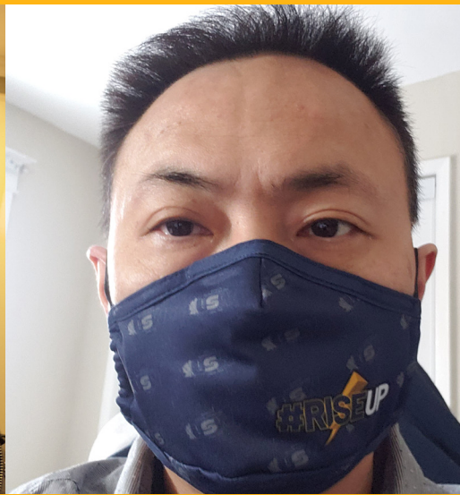
Membre du Comité AARON MA