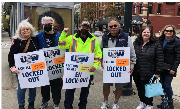
Membres des Métallos 2009