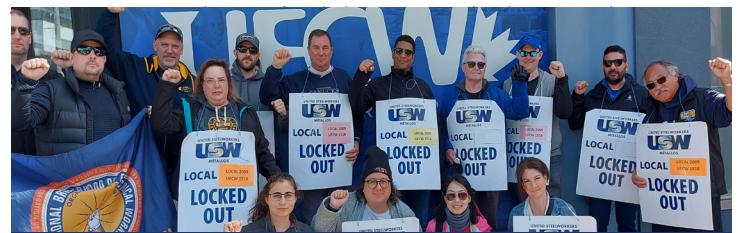
Membres des Métallos 2009