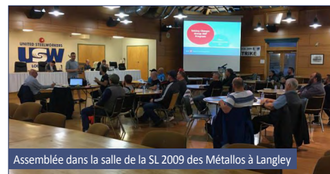
Assemblée dans la salle de la SL 2009 des Métallos à Langley