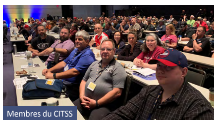
Membres du CITSS