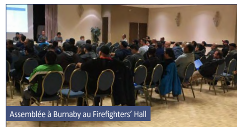
Assemblée à Burnaby au Firefighters' Hall

Merci à tous les membres qui ont pris sur leur temps libre pour assister à ces assemblées. Lorsque des changements doivent être décidés, il est important que vous preniez part au processus de décision. Votre voix compte, faites-la entendre !