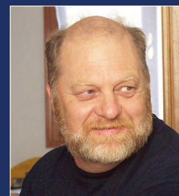
Hommage à l'ancien Vice-Président du STT